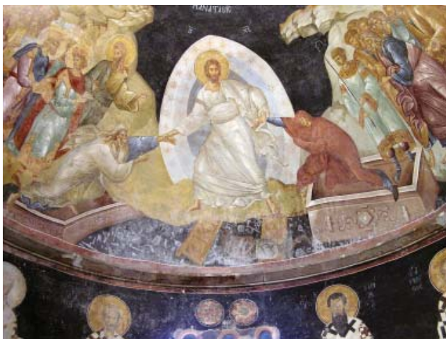
7 Byzantinisch, Anastasis , verm. frühes 14. Jh., Fresko, Chora-Kirche, Istanbul

Um Caravaggios Gemälde besser zu verstehen, sei genauer als bisher der anspielungsreichen Ikonografie des Bildes nachgegangen, denn der Künstler spielt mit einzelnen Personen aus der Gruppe