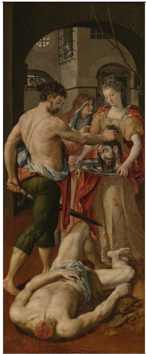
13 Maerten de Vos, Die Enthauptung des Johannes des Täufers , 1574, Öl auf Leinwand, 220,8 × 88,9 cm, Koninklijk Museum voor Schone Kunsten, Antwerpen

Ein Nachstich des Gemäldes von Johann Sadeler, der vor 1600 entstanden sein muss, gibt die Tafel in Teilen wieder. 51 Besonders die Enthauptungsszene mit dem austretenden Blut im Vordergrund muss in diesem Zusammenhang genannt werden. Caravaggio könnte sich für die Darstellung seines athle-