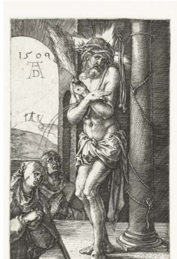
15 Albrecht Dürer, Schmerzensmann an der Säule , 1509, Kupferstich, 119 x 76 mm, Rijksmuseum, Amsterdam, RP-P-OB-1159

tischen Henkers am Vorbild de Vos/Sadeler inspiriert haben. Der ausgestreckte Arm mit den hervortretenden Muskeln ist hier jedenfalls vorgebildet. Dies gilt ebenso für das Motiv der Blutlache, die bis an den vorderen Bildrand reicht. Wie sehr die Figur des Henkers durch Caravaggio aufgewertet wird, macht schon der Umstand deutlich, dass er die vertikale Achse des Bildes bezeichnet. Das Messer in seiner hinter dem Rücken befindlichen Hand markiert dabei den etwas aus dem absoluten Zentrum gerückten Punkt auf Höhe des unteren Randes des Gefängnisfensters, welcher zugleich den goldenen Schnitt bildet. Der Künstler hat mit dieser Hand des Täters zugleich einen Kommentar verbunden, der ein anderes berühmtes Kunstwerk betrifft. So bezieht er sich auf Donatellos Bronze-David (Abb. 14), der seine linke Hand, die den tödlichen Stein hält, hinter dem Rücken an die Hüfte führt. Auf diese Weise inszeniert der Künstler die Tat des Henkers als eine notwendige, gottgewollte Handlung, bei der aus dem Stein das Messer wird.