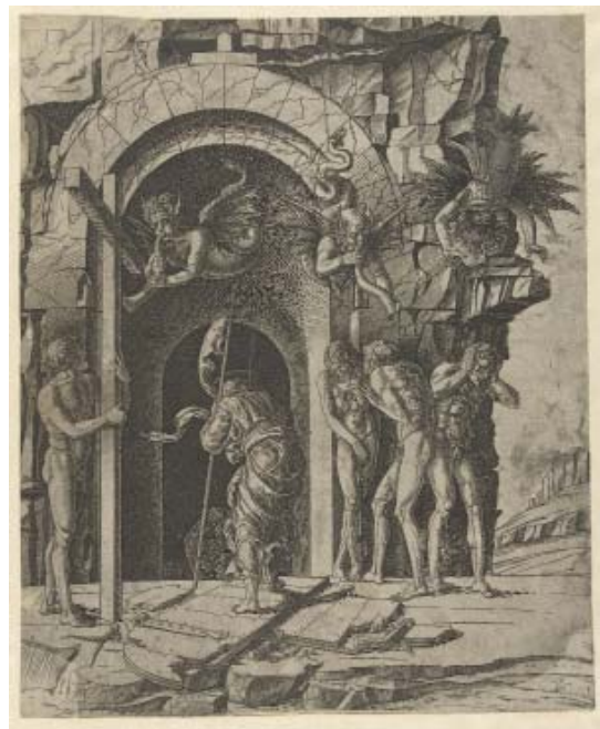
8 Andrea Mantegna, Christus in der Vorhölle , 1470–1480, Kupferstich, Rijksmuseum, Amsterdam, RP-P-H-A-6

Zur Ikonografie dieser Thematik, die sich vor allem in zahlreichen grafischen Beispielen beobachten lässt, gehört die Darstellung eines mächtigen steinernen Tores. Zahlreiche grafische Beispiele dieser Ikonografie lassen sich hier nennen, die sich allesamt durch ein mächtiges steinernes Tor auszeichnen. In der Regel befreit Christus in diesen Werken Johannes, Adam, Eva, Abel und die wartenden, auf Befreiung hoffenden Seelen. Wie ein Blick auf einen Kupferstich des Abstiegs in die Vorhölle nach Andrea Mantegna zeigt (Abb. 8), findet sich dort neben dem mächtigen, frontal präsentierten Tor auch eine nackte männliche Seele, die in identischer Weise wie die alte Frau bei Caravaggio ihr Entsetzen zum Ausdruck bringt. Bei dieser Seele handelt es sich um Abel, den ersten Märtyrer des Alten Testaments und gleichsam den Prototypen aller dann folgenden. Wie zahlreiche andere Werke zeigen, gehört er zu den Ersten, die durch Christus aus der Vorhölle erlöst werden. Durch seinen unverschuldeten Tod wird er Vorbild und Präfiguration Christi und in mittelalterlichen Darstellungen wie ein Geistlicher mit Tonsur dargestellt. 45 Wichtig ist aber auch die Rolle, die Johannes in dem Zusammenhang zukommt, und wie ihm Gerechtigkeit widerfährt. So zeigt Albrecht Dürers Holzschnitt (Abb. 9) von 1510 ebenfalls, wie sich Christus in der Vorhölle vorbeugt und die Hände eines Mannes ergreift, während ihn der