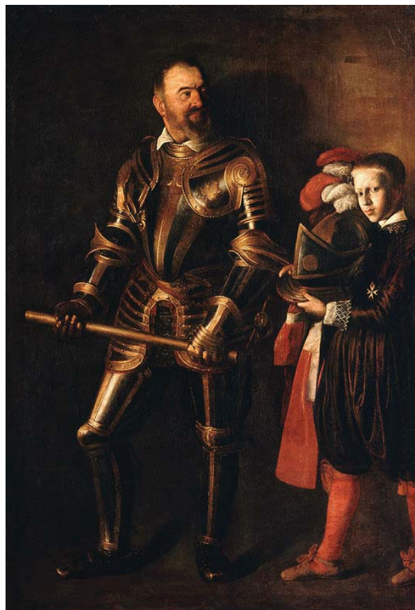
2 Caravaggio, Porträt von Alof de Wignacourt , um 1608, Öl auf Leinwand, 194 x 134 cm, Musée du Louvre, Paris, INV. 57

Dem Künstler ist es mit dem großformatigen Gemälde gelungen, eine Komposition zu gestalten, die man aus unterschiedlichen Abständen anschauen kann. Denn blicken wir – im Oratorium stehend – darauf, so wird es zum Innenhof des Kerkers, in dem sich das Geschehen ereignet. Durch die Darstellung wird der Innen- zum Außen- und der Bild- zum Betrachterraum. Und wir werden zu Zeugen, die das traurige Geschehen begleiten. Doch nicht nur in Bezug auf die Raum-, sondern auch hinsichtlich der präsenten Beleuchtung nimmt das Gemälde Rücksicht auf den konkreten Anbringungsort, befand sich doch links oberhalb des Werks eine Fenstersituation, die der Lichtregie des Künstlers eine große