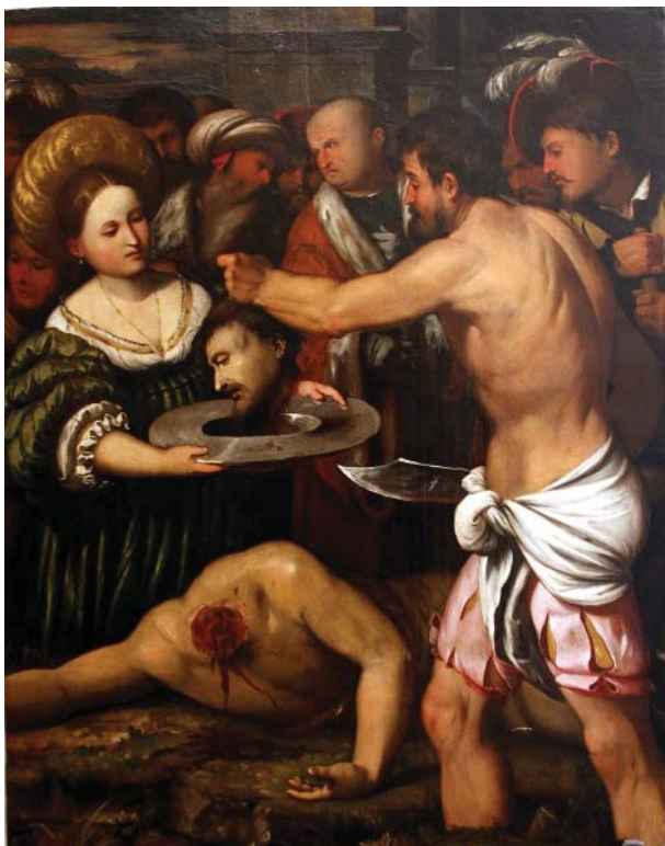
3 Callisto Piazza, Die Enthauptung des Johannes des Täufers , 1528, 119 × 92,5 cm, Galleria dell'Accademia, Venedig

Das Gemälde hat zahlreiche Deutungen hervorgebracht, doch eine befriedigende Analyse steht bis heute aus. 22 Das liegt zum Teil sicherlich daran, dass das Bild nicht mit den bestehenden Salome- und Enthauptungs-Traditionen in Verbindung zu bringen ist. 23 Bereits die Frage, ob wir es bei der jungen Frau links mit Salome und bei der Alten mit ihrer Dienerin zu tun haben, wird in der Forschung kontrovers beurteilt. Doch das dunkelgrüne Kleid und das weiße Obergewand mit schmaler Goldbordüre machen es plausibel, dass wir es mit der Tochter der Herodias zu tun haben, die ungemein agil und beweglich erscheint. Aber warum führt die Alte ihre Erschütterung so deutlich vor, wie es für die Tradition gänzlich untypisch ist? In formaler Hinsicht stellt sie im Sinne Albertis eine Vermittlungsfigur dar, die Empathie mit dem Opfer zum Ausdruck bringt und zugleich von uns fordert. In der Regel geht mit der Salome- und Enthauptungs-Ikonografie des Johannes