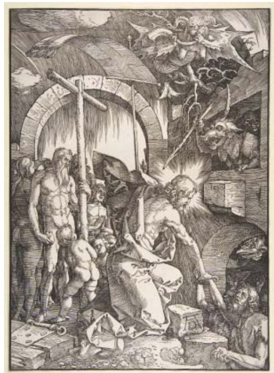
9 Albrecht Dürer, Christus in der Vorhölle , 1510, Holzschnitt, 394 × 283 mm, The Metropolitan Museum of Art, New York, 22.51.5