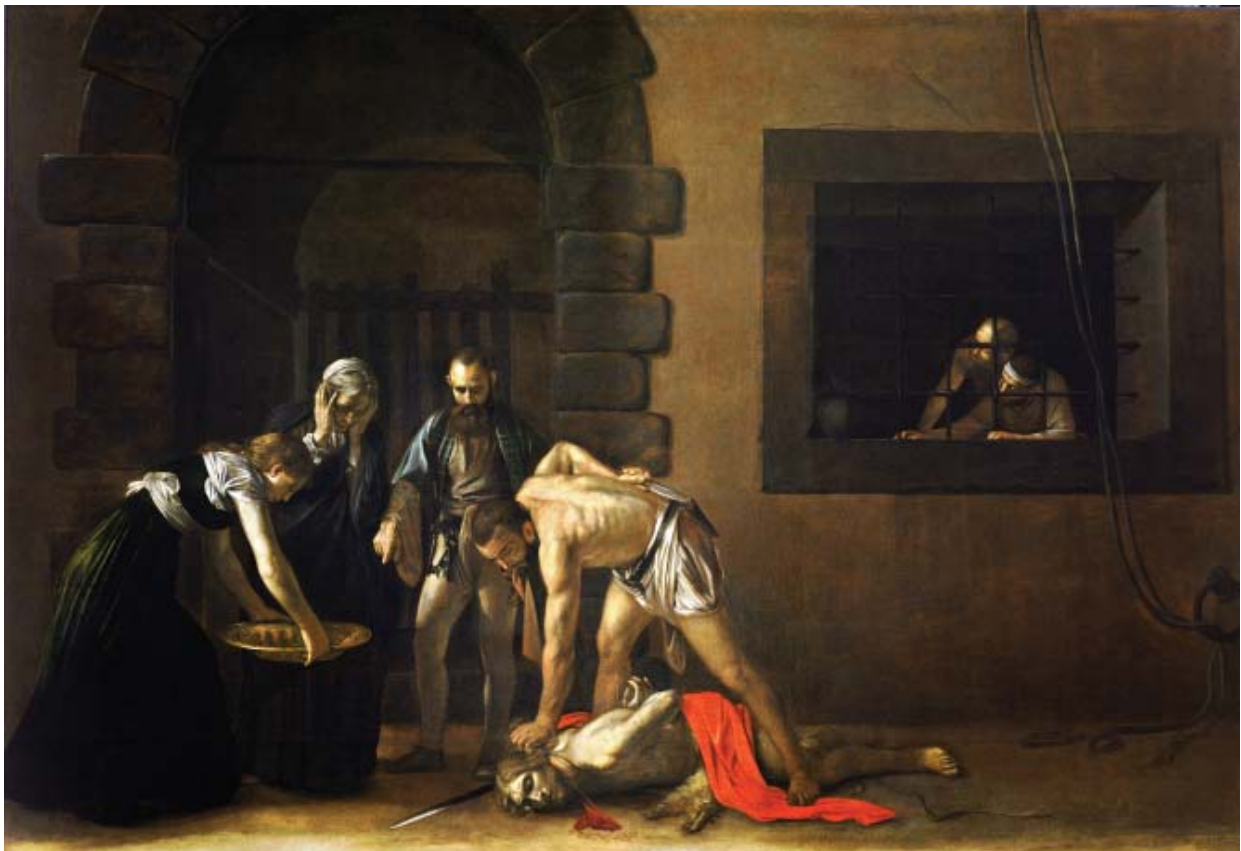
1 Caravaggio, Die Enthauptung Johannes des Täufers , 1608, Öl auf Leinwand, 361 × 520 cm, San Giovanni, La Valletta

Es ist eine bedrückende Stille und Verlorenheit, mit der sich der Betrachter konfrontiert sieht (Abb. 1). 2 Das Geschehen vollzieht sich konzentriert und leise. Als würde die Welt für einen Moment den Atem anhalten, bevor der Scharfrichter seines Amtes waltet und die Dekapitation durchführt. Der Kerkermeister zeigt auf die große Schale, die Salome für den Kopf von Johannes bereithält. Die alte Frau daneben fasst sich mit beiden Händen entsetzt an die Schläfen. Ihr Mund ist geschlossen, ihr Ausdruck fassungslos. Der nur mit einem Lendenschurz bekleidete Henker hat sich weit vorgebeugt, um den Kopf des Johannes bei den Haaren zu fassen, während zu seinen Füßen das Richtschwert liegt. Sein linker athletischer Arm ist durchgestreckt und die angespannte Rückenmuskulatur sticht besonders ins Auge. Er ist im Begriff, sein Messer aus dem Futteral zu ziehen, das an seinem schwarzen Gürtel befestigt ist. Nun hält er einen Moment inne, um sein Tun und den besten Ansatzpunkt für den Schnitt