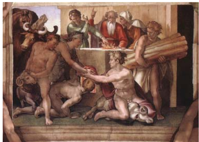
12 Michelangelo, Brandopfer Noahs , um 1508–1510, Fresko, 170 × 260 cm, Sixtinische Kapelle, Vatikan