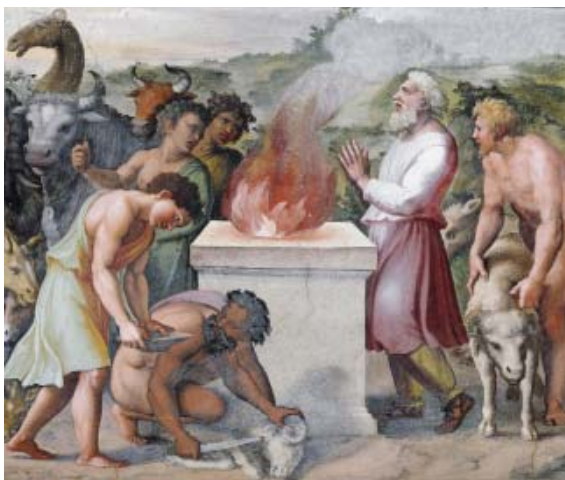
11 Raffael, Brandopfer Noahs , 1518–1519, Fresko, Palazzo Apostolico, Loggia di Raffaello, Vatikan

Um den Zusammenhang mit der Idee des Martyriums zu verdeutlichen und dem Betrachter Hinweise auf den Bund mit Gott zu geben, nutzt der Künstler weitere Motive der Opferikonografie. So