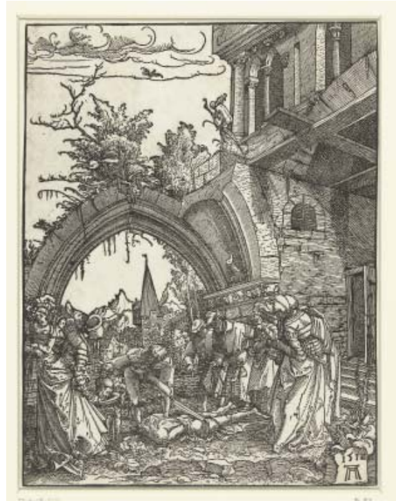
6 Albrecht Altdorfer, Die Enthauptung des Johannes des Täufers , 1512, Holzschnitt, 204 × 156 mm, Rijksmuseum, Amsterdam, RP-P-OB-3051