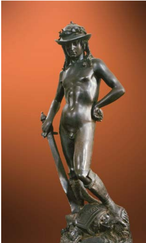
14 Donatello, David , 1444, Bronze, 158 cm, Museo Nazionale del Bargello, Inv. Bargello n. 95 B