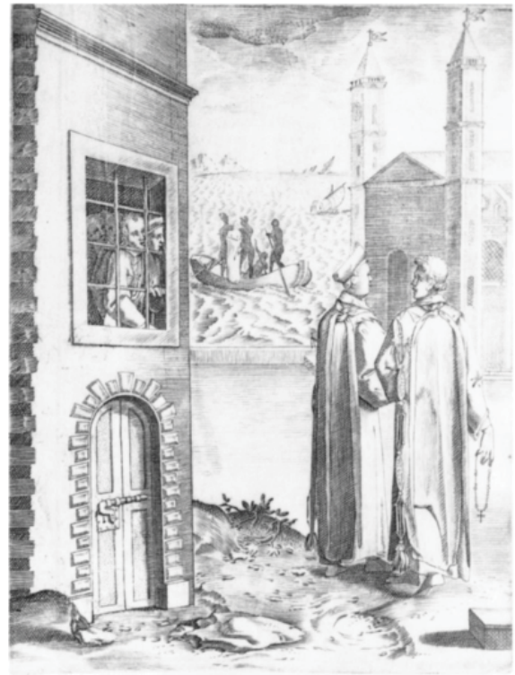
5 Statuta Hospitalis Hierusalem , Rom 1588, Illustration zu Statut XVIII: De prohibitionibus et poenis