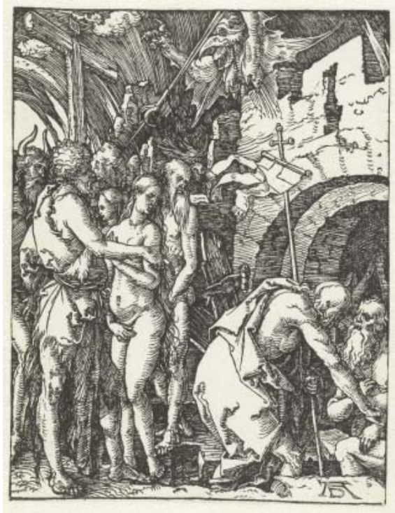
10 Albrecht Dürer, Christus in der Vorhölle , 1509, Holzschnitt, 127 × 97 mm, Rijksmuseum, Amsterdam, RP-P-OB-1345

Täufer erwartungsvoll anblickt und wir links Adam mit dem Kreuz und Eva erkennen. 46 Auch in der kleinen Holzschnittpassion (Abb. 10) ist die Konzeption vergleichbar. Einmal mehr hat der Erlöser das Höllentor aufgestoßen, um die schuldlos in der Vorhölle Wartenden und vor allem Johannes zu befreien, der sehnsüchtig zu ihm aufblickt.