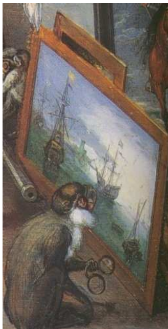
2 Detail aus Abb. 1