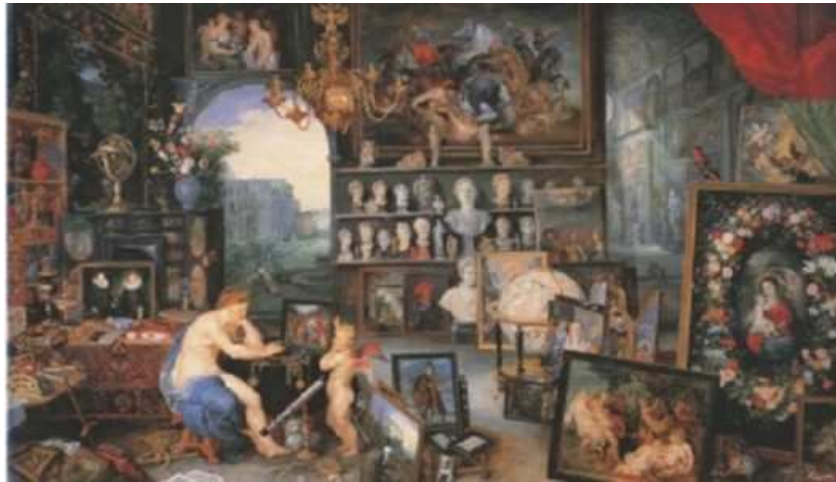
1 Jan Brueghel d. Ä. und Peter Paul Rubens: Allegorie des Sehens , 1617, Öl auf Holz, 65 x 109 cm, Madrid, Museo Nacional del Prado

Ein Bild, auf das die oben genannten Beschreibungen beider Inventare zutreffen, wird dagegen in der Allegorie des Sehens (1617) aus dem Zyklus der Fünf Sinne von Jan Brueghel d. Ä. (1568-1625) und Peter Paul Rubens von einem brillenbewehrten Affen (Simiolus?) in Augenschein genommen; ein zweiter kommt gerade mit einem Fernrohr um die Ecke (Abb. 1). 9